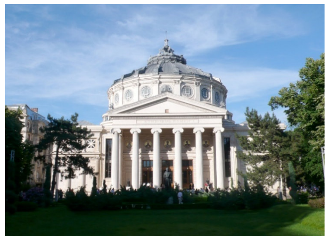
Athenäum - Bukarest

Heute erreichen Sie Bukarest, die Hauptstadt Rumäniens. In einem Land der Gegensätzlichkeit ist Bukarest die Hauptstadt der Kontraste. In der zweiten Hälfte des 19. Jh.s wurde Bukarest auch „Klein-Paris des Ostens“ genannt. Gebäude, die nach Plänen französischer Architekten entstanden sind, Fassaden im typischen französischen Stil, breite Boulevards und viele Parks rechtfertigen diesen Beinamen. Erdbeben und die Zerstörungen im Auftrag von Ceauşescu haben dazu beigetragen, dass im Zentrum der Stadt sehr viele neue Gebäude entstanden sind. Dazu zählt auch der kolossale Parlamentspalast , nach dem Pentagon in den USA das zweitgrößte Verwaltungsgebäude der Welt. Bei einer Stadtrundfahrt kommen Sie unter anderem vorbei am Arcul Triumf (Triumphbogen), dem Athenäum und dem Bukarester Königsschloss (Außenbesichtigungen).