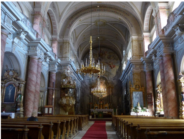
Sibiu katholische Kirche

Der Abend steht zur freien Verfügung und bietet Gelegenheit, in eines der zahlreichen Altstadtlokale einzukehren.