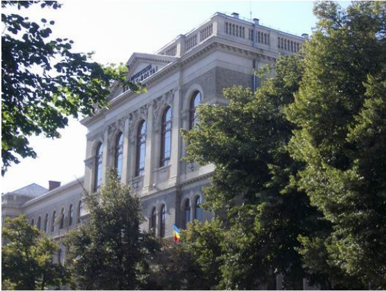
Babes- und Boyai-Universität Cluj

Abendliches Konzert des KMGV im Auditorium Maximum des zur Universität Klausenburg gehörenden Colegiul Academic .