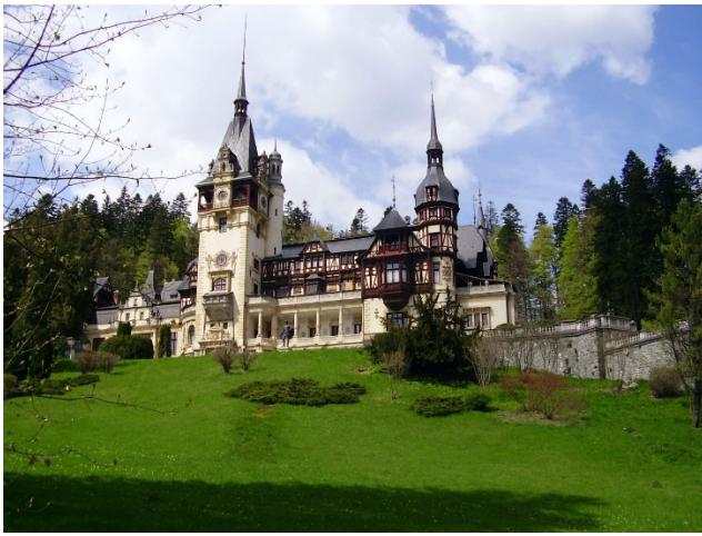
Schloss Peles CCBYSA2.0 tamburix-at-flickr

Während die Sänger für das nächste Konzert proben, ist für Begleitpersonen ein reizvolles Programm vorbereitet. Ein Ausflug führt Sie zum Schloss Peleş in der Nähe des Wintersportortes Sinaia. Die einstige Sommerresidenz von König Carol I. erstreckt sich auf einer weiten Lichtung und wurde im Stil der Neorenaissance errichtet. Ende des 19. Anfang des 20. Jh.s galt es als eines der modernsten Schlösser seiner Zeit, mit u. a. elektrischem Licht und Zentralheizung. Aufgrund seiner Bauweise und dem ornamentalen Fassadenschmuck wird es als „Neuschwanstein“ Rumäniens bezeichnet.