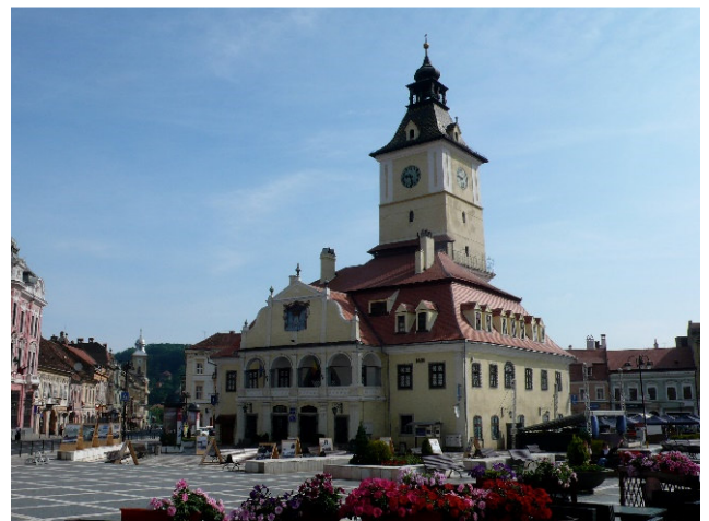
Brasov - Markt

Nach dem Konzert fahren Sie nach Poiana Brasov. Er ist der bekannteste Wintersportort Rumäniens. Auf der Fahrt werden Sandwiches gereicht. Zimmerbezug für 2 Übernachtungen.