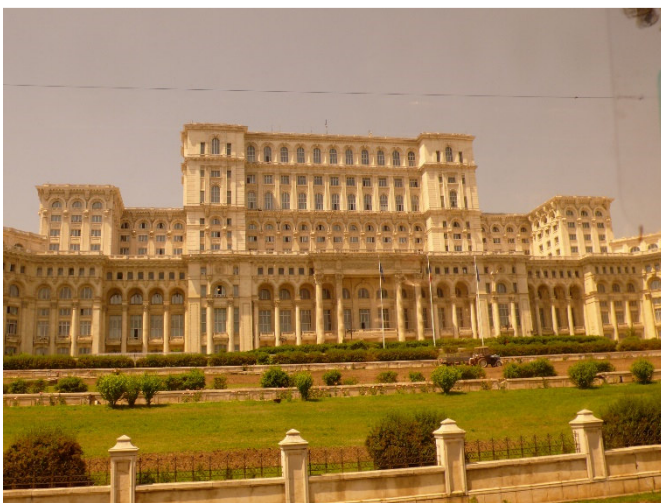
Bukarest - Parlamentspalast

Gemeinsames Abschiedsabendessen im Hotel.